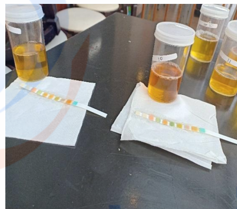
Gambar 7. Sampel Urin