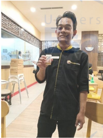
Gambar 1. Pengumpulan urin