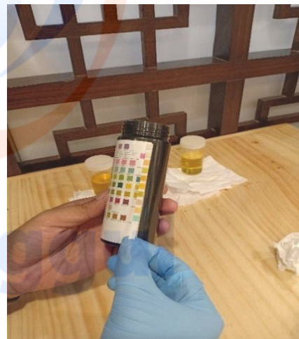
Gambar 5. Pengukuran BJU