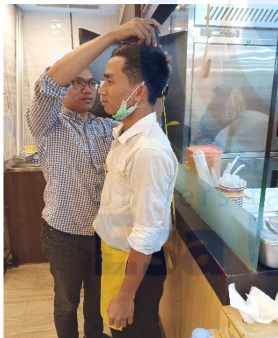
Gambar 4. Pengukuran IMT