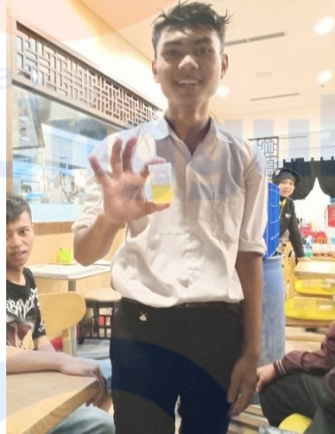
Gambar 2. Pengumpulan urin