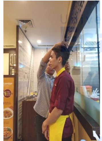
Gambar 3. Pengukuran IMT